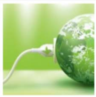
Topic area D: The modern world and the environment