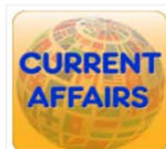
Current affairs and social issues

Select the units you would like to study: