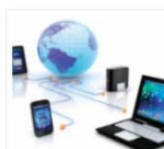
Information and communication technology